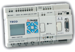
GENIE 10/12点基本组+扩充模块