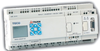
GENIE 20点基本组+扩充模块